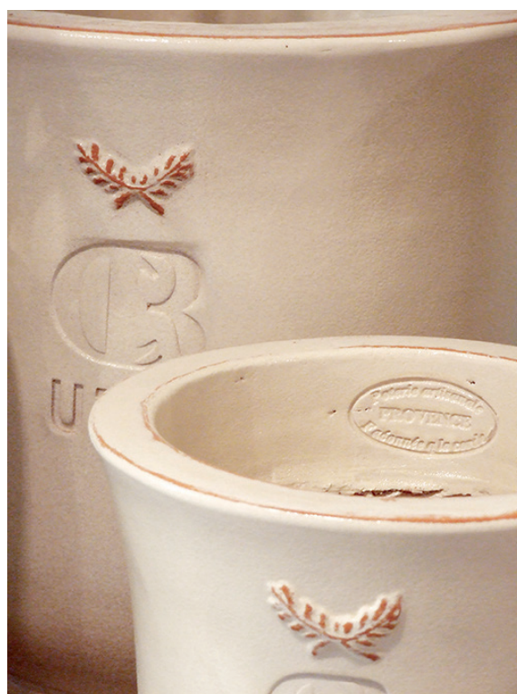
FACONNEE A LA CORDE MARINE